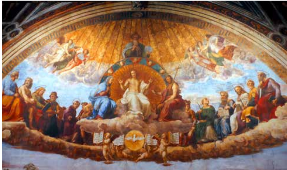
Disputa del Sacramento (Übersetzt: Auseinandersetzung um die Eucharistie), von Raffaello Santi, entstanden 1508 – 1511, gehört zur Sammlung der Vatikanischen Museen.