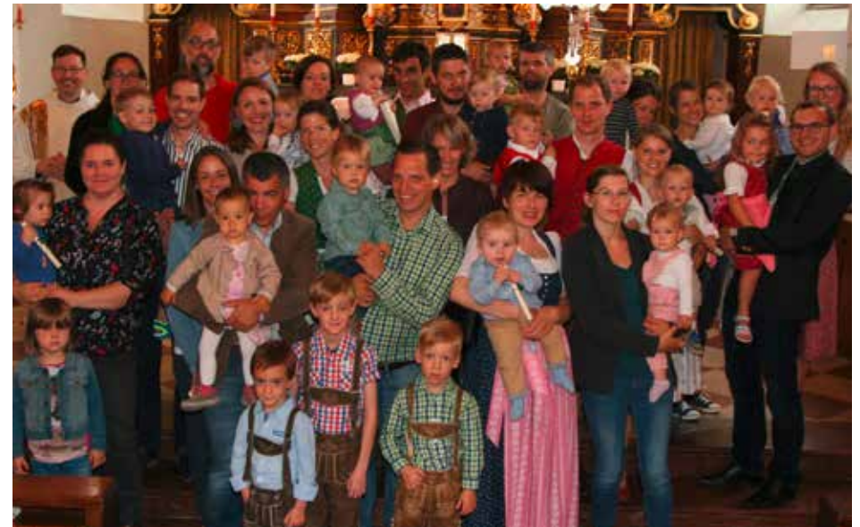
Wir wünschen allen jungen Familien viel Glück und Freude mit ihren Kindern.